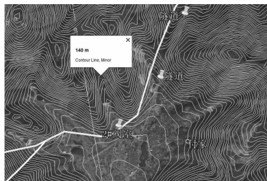
图4 叠加等高线后的实例

在我国,1:30万的各省份DEM数据可免费从网上下载使用。首先使用Global Mapper软件将DEM数据生成等高线,并输出为Google Earth交换数据格式KMZ文件,然后导入并与目标区域内的卫星影像图叠加,如图4所示。