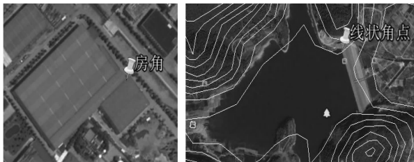
图 1 共同点坐标对的选取

一般来说, 由于坐标点对选取受影像图精度、测量误差、人眼误差等的影响, 获取的值不是精确值, 所以单次校正范围的管道中线不宜过长。