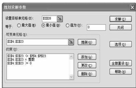
图 4 最短工期规划求解设置